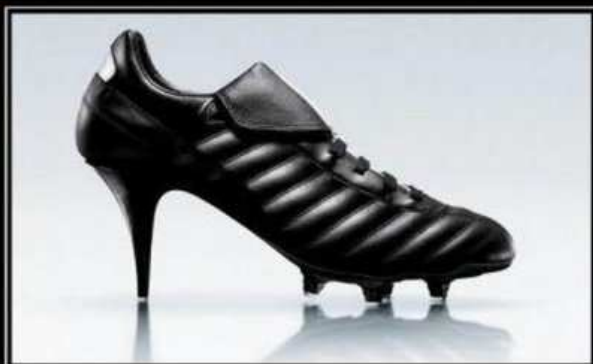
ОНИ отбирают у нас святое