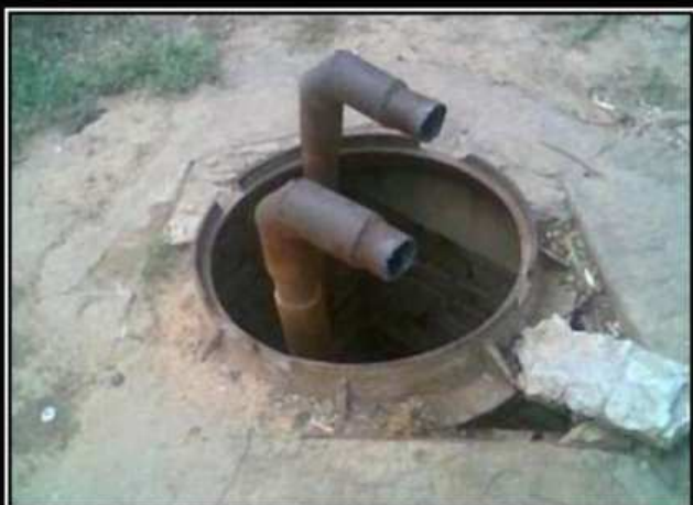
ПОДВОДНЫЙ НАНОФЛОТ РОССИИ осваивает новые территории